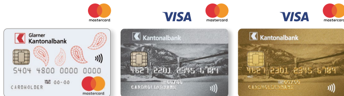
Die Glarner Kreditkarte

Unterschiede bestehen in den Versicherungsleistungen – und im Preis.